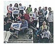
多国籍で大山登山