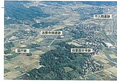
倉吉市・古代遺跡周辺

伯耆国庁、伯耆国分寺、伯耆国分尼寺を擁した古代の倉吉は、伯耆国(鳥取県中西部)の政治・経済・文化の中心地でした。奈良時代初期の七二六年には著名な万葉歌人山上憶良が国司として赴任しています。憶良が職務に励んだ伯耆国庁は、現在国庁跡として知られる場所ではなく、それより二五キロほど東に位置し河運の便が良い不入岡(ふにおか)遺跡にあつたのではないかと想像されています。