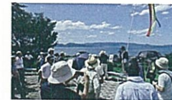
安来市荒島・古代王陵の丘にて

五世紀前半の中海沿岸(特に安来市荒島の古墳。その素晴らしい景色を現地の景観を背に見学させて頂くと「万葉歌人・門部王の、 「意宇の海の 河原の千鳥 汝が鳴けば わが佐保河の 思ほゆらくに」