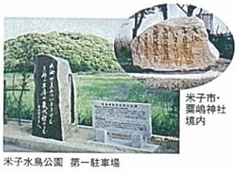
市・神社 子嶋内 米子境内 米子水鳥公園 第一駐車場

当日は晴れ渡った秋空の下、「辛の崎」からは鳥根半島や三瓶山がくっきりと見渡せました。また、反対方向に目を振れば、江津方面の海岸もはつきり見え、浅利富士や星高山(高角山)も目に入るようで、人麻呂さんになりきることができました。なお、岬の手前には、「伝人麻呂神社跡地」もあります。(石見銀山ガイドの会 副会長)