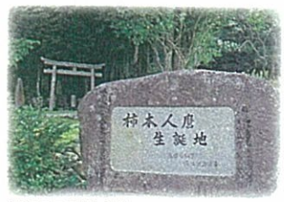
益田市・戸田柿神社

玉藻なす 寄り寝し妹を。美しい藻のように寄り添って寝た妻。妹が門見む 靡けこの山。妻の家の門が見たいとけ山よ。現代の草食男子では到底発想しないまめかしく、情熱的な恋心が表現されている。歌碑の前に立つ「平成の日本男児よ情熱的な恋をしろ」とひとまるさんが叫んでいるような気がしてならない。冬の山陰の天気は変わりやすく、天気予報とにらめっこしながら撮影を続けているが、とても順調とはいきれない。さてさてどんな映像に仕上がるやら、三月二十六日「ひとまるシンポジウム in IWAMI」を期待あれ。