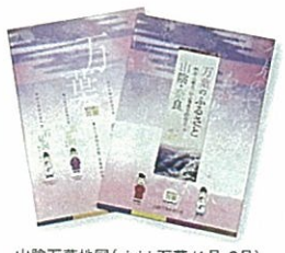
山陰万葉地図(vivid 万葉/1号・2号)

共催であったため、多くの大学生も参加され、本会の活動を広く知っていただく良い機会であったと思っています。(江津市商工観光課)