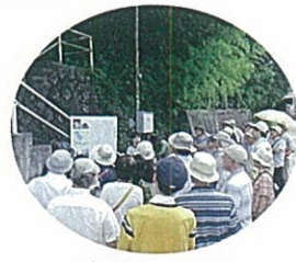
安来市・昆壳塚古墳前

そんな感慨を持ちながら参加させて頂いたこのプロジェクトへの大きな期待をこでお伝えできればと思います。