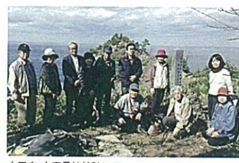
大田市・人麻呂神社跡にて

午後には、五十猛町にある人麻呂ゆかりの地点を探訪しました。五十猛町大浦には「大崎ヶ鼻」と呼ばれる日本海に突き出した岬があつて、古くは「辛の崎」と呼ばれていました。地元には万葉集に詠われている、あ